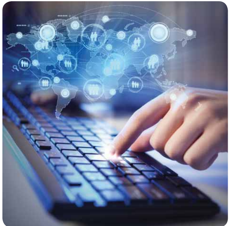
La filosofía posmoderna destaca los efectos de la tercera revolución industrial que ha ocurrido por el desarrollo de las tecnologías de la información y el auge de los medios de comunicación, entre otros sucesos.

Posmodernismo. Designa los movimientos culturales, artísticos, filosóficos y literarios que surgieron en el siglo pasado, específicamente entre las décadas de 1960 y 1980 con el propósito de superar la modernidad porque consideran que su proyecto ha sido un fracaso, pues no se han cumplido sus ideales.